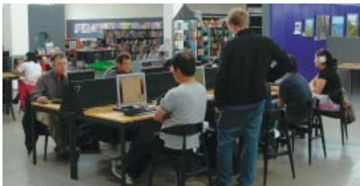
Næstved Bibliotek nu med Borgerservice 10