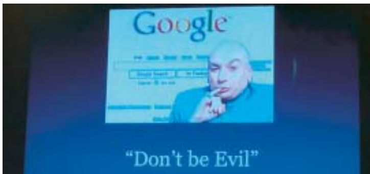
IFLA: E-bøger, Google og overvågning af borgerne til debat 15