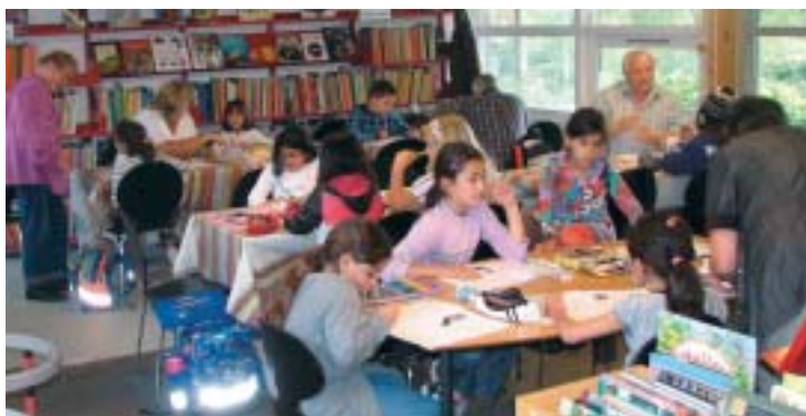
Ny struktur og Lektiecafé i Fredensborg 13